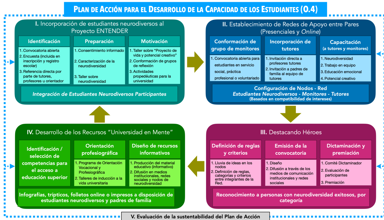
Figura 1. Mapa conceptual del Plan de Acción para el Desarrollo de la Capacidad de los Estudiantes